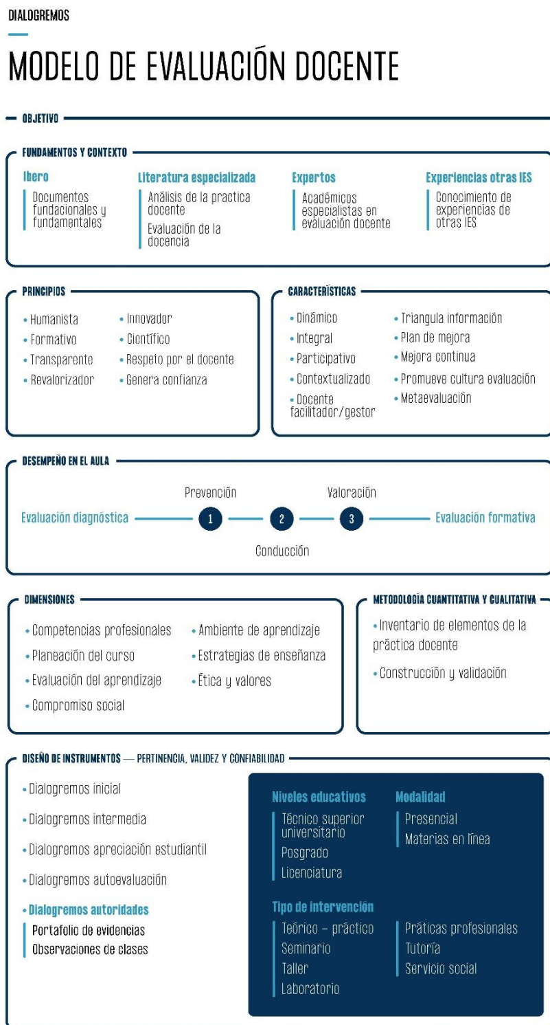
Figura 2 Modelo Dialogremos

Una característica distintiva es que está orientado a la mejora continua de la práctica docente en una constante búsqueda de mejores aprendizajes de los estudiantes. Parte de la evaluación e integra la retroalimentación, lo que permite enfocar los esfuerzos de formación y superación en un plan articulado y sistemático para consolidar una planta docente de calidad.